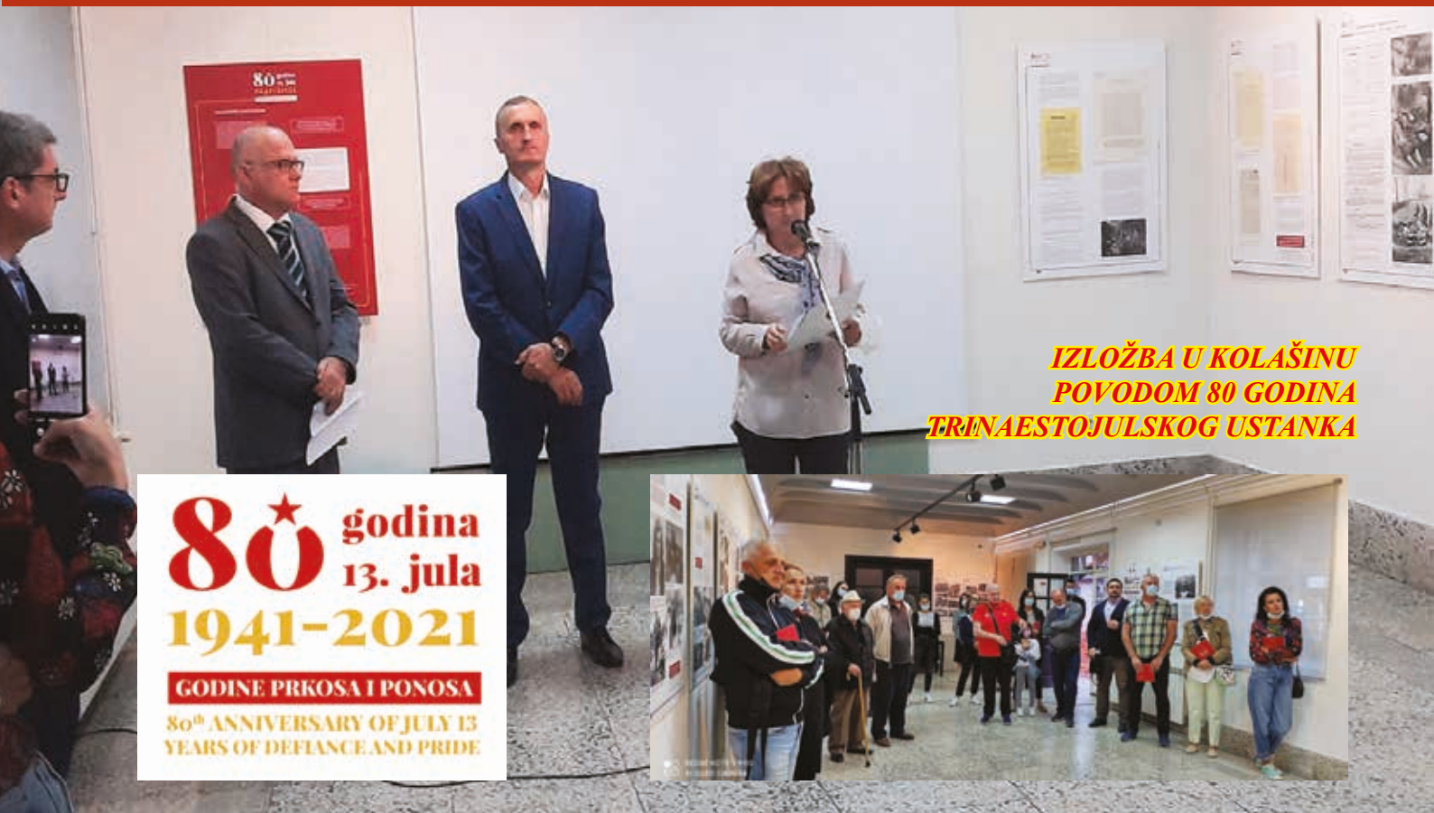
IZLOŽBA U KOLAŠINU POVODOM 80 GODINA TRINAESTOJULSKOG USTANKA

GODINA XXI. _ BROJ 130. _ SRPANJ-KOLOVOZ / JULI-AVGUST _ 2021.