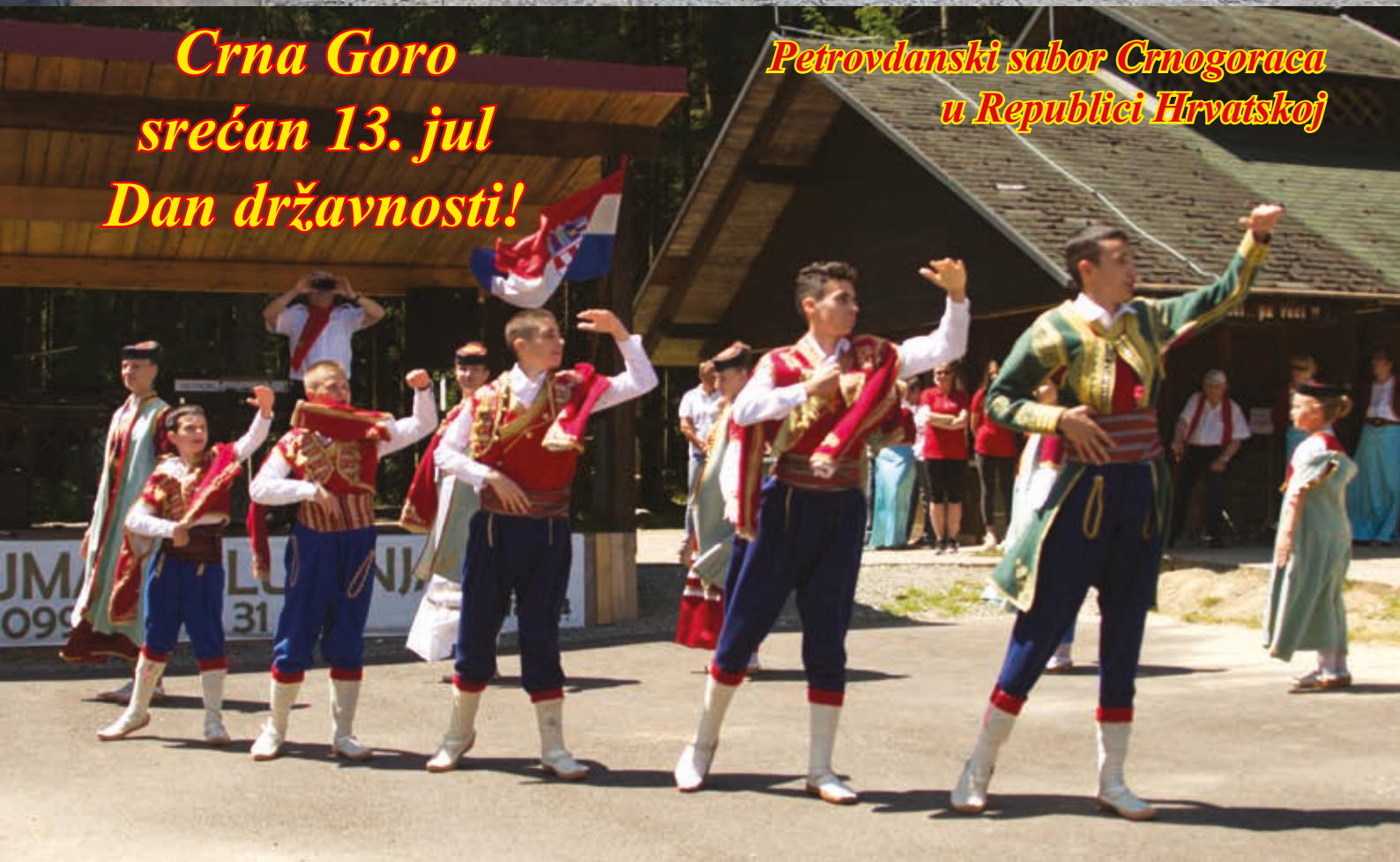
Crna Goro srećan 13. jul Dan državnosti!