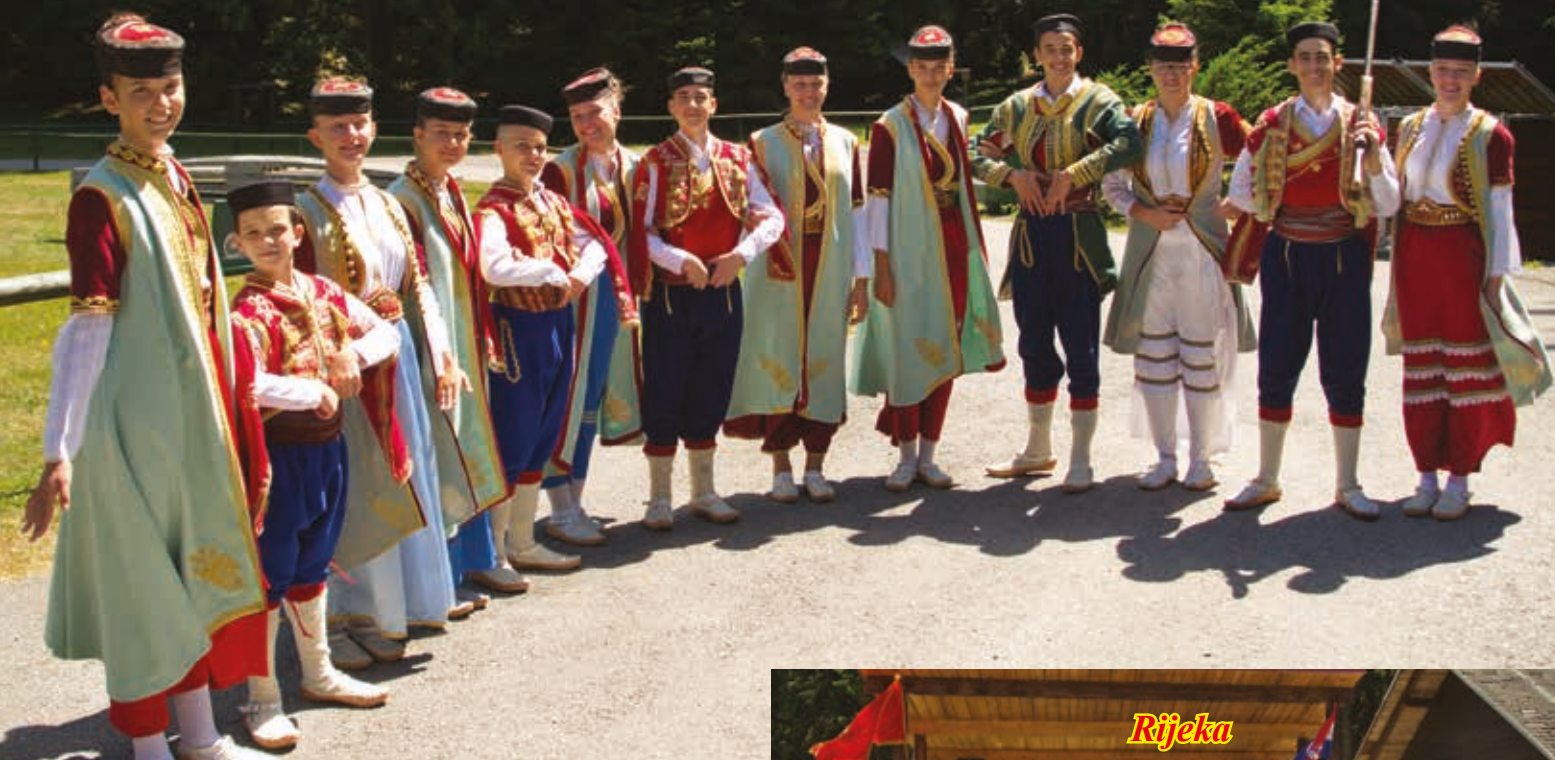
Zajednički nastup folklornog društva - Kulturnog centra "Stara Budva" iz Budve i domaćina - Folklornog društva "Umag" 12. jula u Umagu