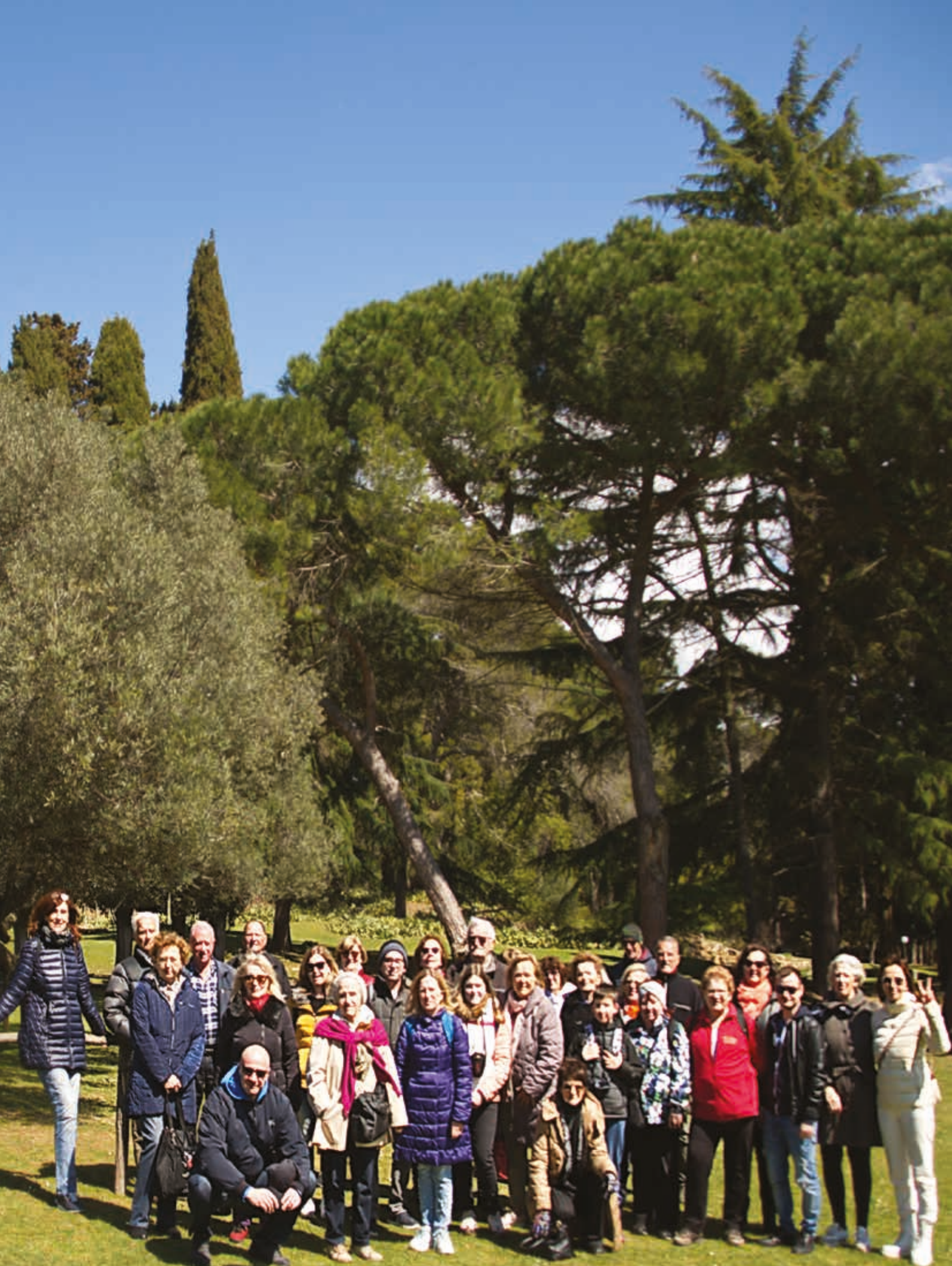
Nacionalna Zajednica Crnogoraca Rijeka, organizirala je za članove zbora i ostale pripadnike zajednice 10.04.2022. godine izlet na Brijune. Izlet je organiziran u sklopu programa "Upoznajmo Hrvatsku".