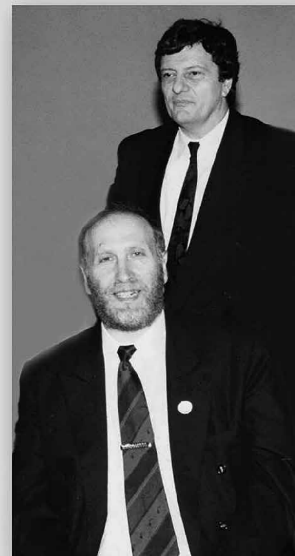
Robert James "Bobby" Fischer & Bozidar Bonja Ivanović

Osvojio je i dvije srebrne medalje sa reprezentacijom SFR Jugoslavije, na Evropskom prvijenstvu u Plovdivu 1983. (1. mjesto; SSSR 2. SFRJ 3. Engleska); i na Svjetskom prvijenstvu u Lucernu 1989. (1. SSSR 2. SFRJ 3. SAD.)