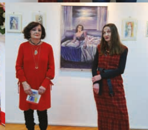
U srijedu 01. 03. 2023. godine u galeriji Montenegrina otvorena je izložba umjetničke keramike društva za likovno stvaralaštvo "Pinelić" iz Kostrene.