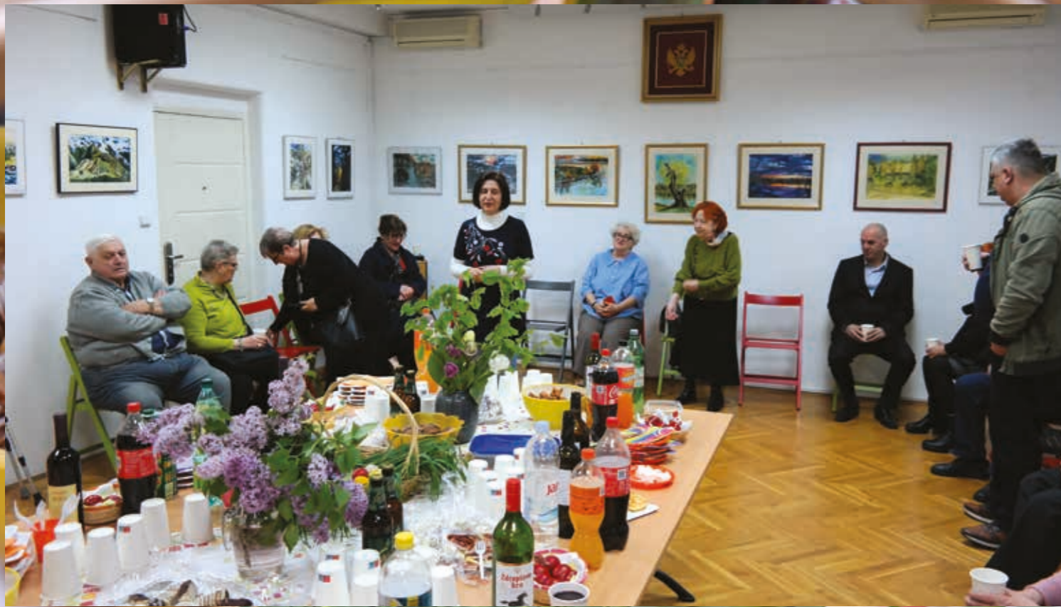
Tradicija prekinuta u protekle dvije pandemijske godine, nastavljena 13. 4. u 19 sati, u Crnogorskom domu povodom Uskrsa / Vaskrsa u organizaciji Društva Crnogoraca i prijatelja Crne Gore "Montenegro" Zagreb i Vijeća crnogorske nacionalne manjine Grada Zagreba