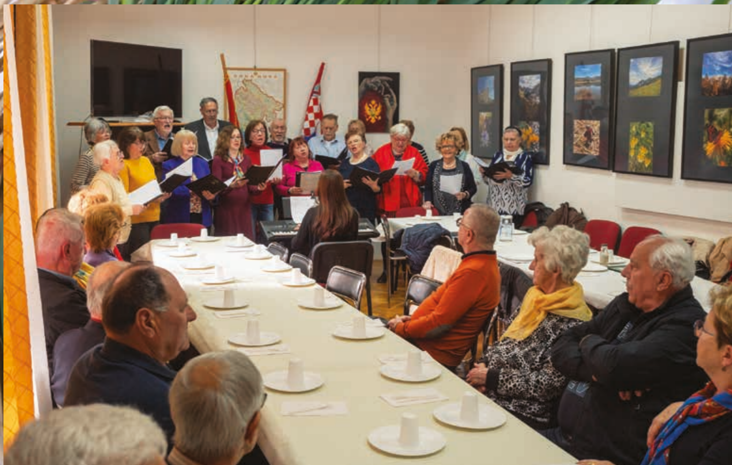
Nacionalna zajednica Crnogoraca Rijeka sa gradskim i županijskim vijećem crnogorske nacionalne manjine, upriličila je obilježavanje Vaskrsa - Uskrsa, 12. 04. 2023. za Crnogorce i prijatelje Crne Gore