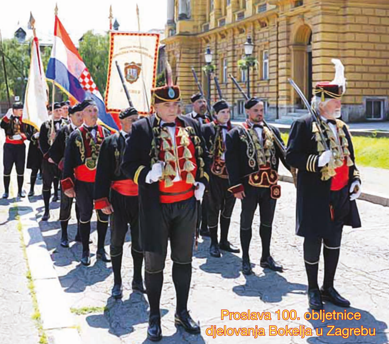
Proslava 100. obljetnice djelovanja Bokelja u Zagrebu