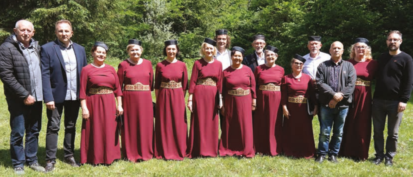
Proslava Dana nezavisnosti Crne Gore u Sloveniji