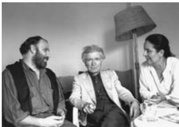
Kod Emila Ciorana u Parizu, 1989

„Bio sam kod Emila Ciorana prošli četvrtak“, odgovorio sam.