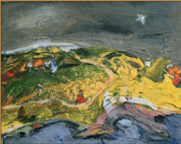
Rajko Todorović - Todor: GUBILIŠTE