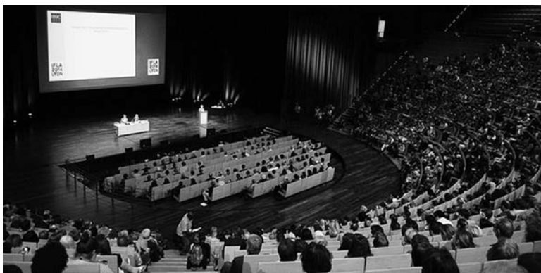
Završna sjednica kongresa koji je u Lionu, od 16. do 22. avgusta, okupio 2590 delegata iz 132 zemlje

Nacionalna biblioteka Crne Gore „Đurđe Crnojević“ učestvovala je krajem avgusta na Kongresu WLIC (World Library and Information Congress) u Lionu.