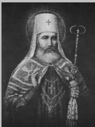
Sv. Petar cetiniski Čudotvorac