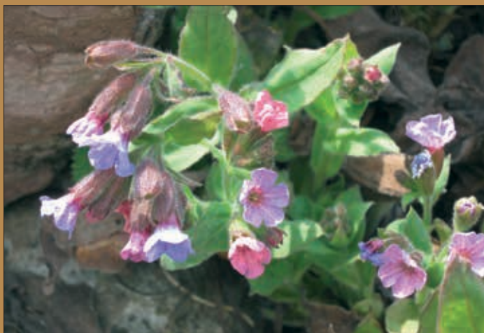
Plućnjak – Pulmonaria officinalis

SA IZLOŽBE FOTOGRAFIJA PLANINSKOG BILJA CRNE GORE - Ljekovito bilje