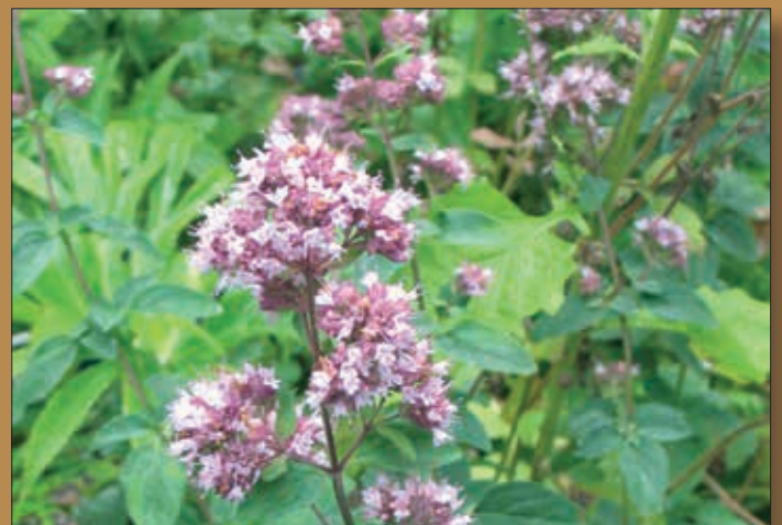
Planinski čaj, Origano – Origanum vulgare