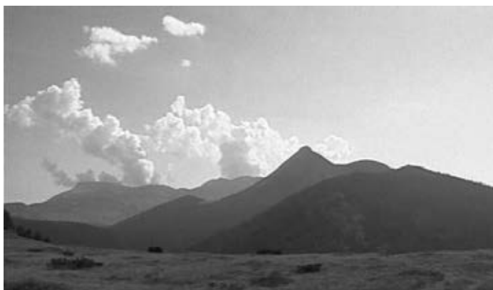
Ljepotica Hajla sa 2403 metra nadmorske visine

Autor: Pero Radović Producent: Radivoje Brnović Kamera: Savo Jovanović Ton: Željko Martinović Trajanje: 30':00" Proizvodnja: TV Crne Gore, 1991.