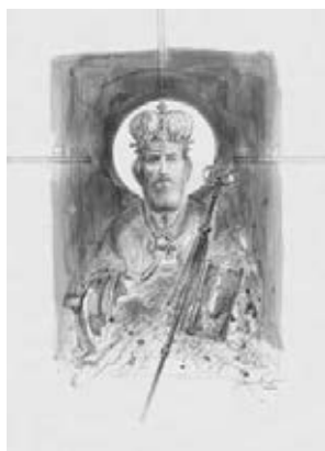
Sveti Petar Čudotvorac Cetinjski (rad Dimitrija Popovića, 2000.g.)

I ove godine, šesnaesti put po redu, Crnogorke i Crnogorci te prijatelji Crne Gore iz svih krajeva Hrvatske, kao i gosti iz Crne Gore i ostalih susjednih država okupili su se da jošjednim Lučindanskim susretima obilježe sjećanje na Petra I Petrovića Njegoša, gospodara Crne Gore i vladiku crnogorskog.