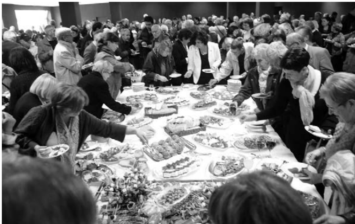
FOTO ZAPIS SA LUČINDANSKOG DRUŽENJA