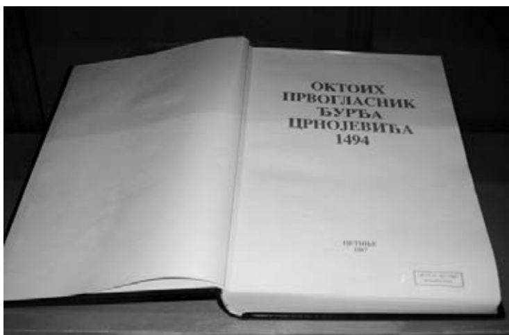
Fototipsko izdanje „Oktoiha Prvoglasnika“ koje je 1987. godine na Cetinju objavila Centralna narodna biblioteka Crne Gore „Đurđe Crnojević“

Povodom 520 godina od štampanja „ Oktoiha Prvoglasnika “, prve ćirilice knjige na Jugoistoku Evrope, u Zetском domu na Cetinju je 16. oktobra održana svečana akademija, a potom izložba grafičke mape „ Oktoih 1494-2014. “ crnogorskog umjetnika Dimitrija Popovića. Proslava jubileja održana je pod pokroviteljstvom predsjednika države Filipa Vujanovića, a organizator je NB „Đurđe Crnojević“.