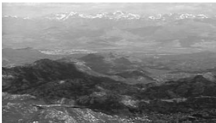
Pogled sa Jezerskog vrha na kamenno more Katunske nahije