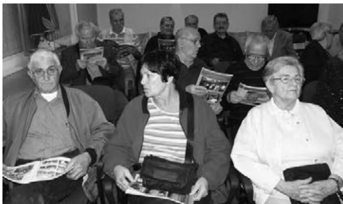
Pred početak još jedne projekcije u Crnogorskom domu u Zagrebu