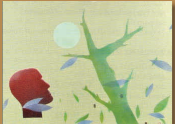
Igor Rakčević: SUMRAK CIVILIZACIJE III

SA IZLOŽBE FOTOGRAFIJA PLANINSKOG BILJA CRNE GORE - Ljekovito bilje