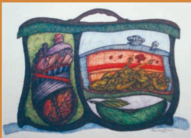
Crtež (pero-tuš u boji, 1994.)