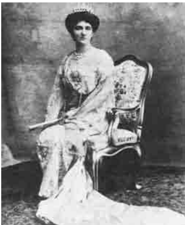
Jelena Savojska: Talijanska kraljica, crnogorska ljepotica

Poslije uvodnog predstavljanja, uslijedila je bračna ponuda. Knjaginjica je svoje prihvatanje usloвила saglasnošću roditelja, našta je princ odgovorio: «Imam i ja roditelje, no ja vas pitam dajete li mi vi vašu ruku i saglasnost da ćete me uzeti, a ja vam nudim moju, ja vas hoću, pa ćemo se docnije zanimati i kod mojih i kod vaših roditelja da nam daju saizvoljenije i blagoslov.» Naravno, Jeleni nije preostalo ništa drugo nego da izrazi svoju bezrezervnu saglasnost. Tako je jednim kratkim jednostavnim, moglo bi se reći simpatičnim, razgovorom krunisano sve ono u što su oba dvora i njihove diplomatije, u toku skoro dvije godine, uložili toliko truda. U drevnom Kremlju, u onoj istoj sali gdje se nadala da će primiti rusku carsku krunu, crnogorska knjaginjica osigurala je kraljevsku italijansku.