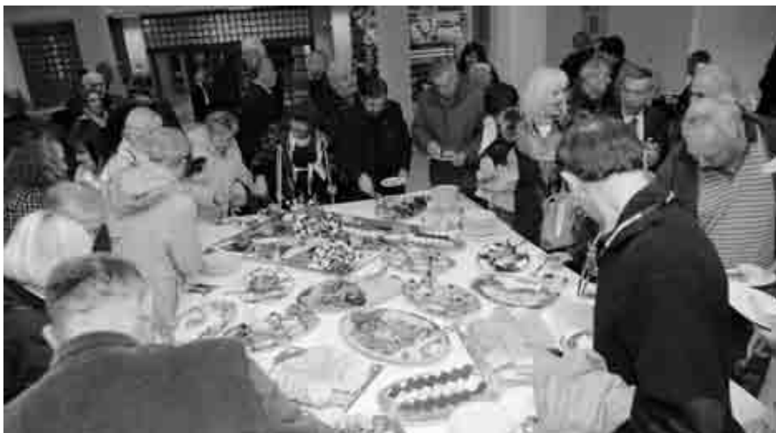
Domjenak u holu Studentskog centra u Zagrebu