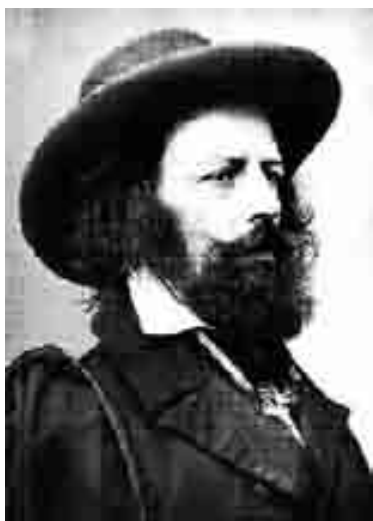
Alfred Lord Tennyson (1809 – 1892)

Alfred Lord Tennyson je rođen 6. 8. 1809. godine u Engleskoj u gradu Somerzby kao četvrto od dvanaestoro djece George i Elizabeth (Fytche) Tennyson.