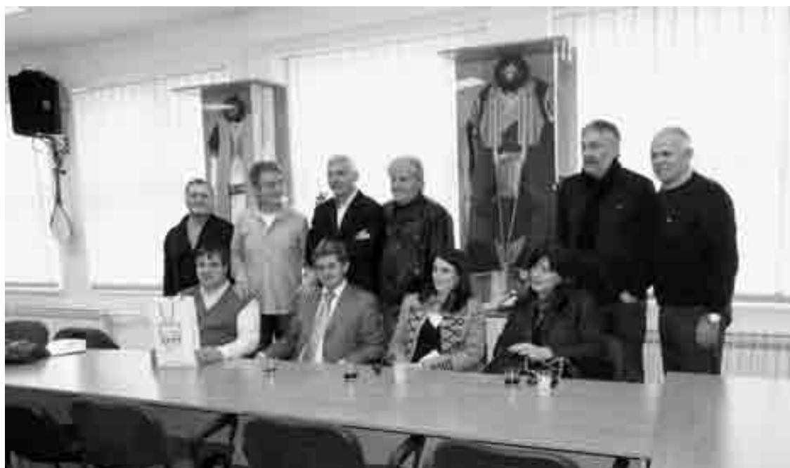
Gosti iz Danilovgrada u Crnogorskom domu u Zagrebu