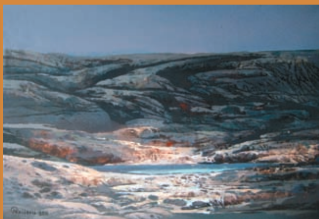
Sa izložbe slika Nikice Raičevića u Galeriji Zvonimir