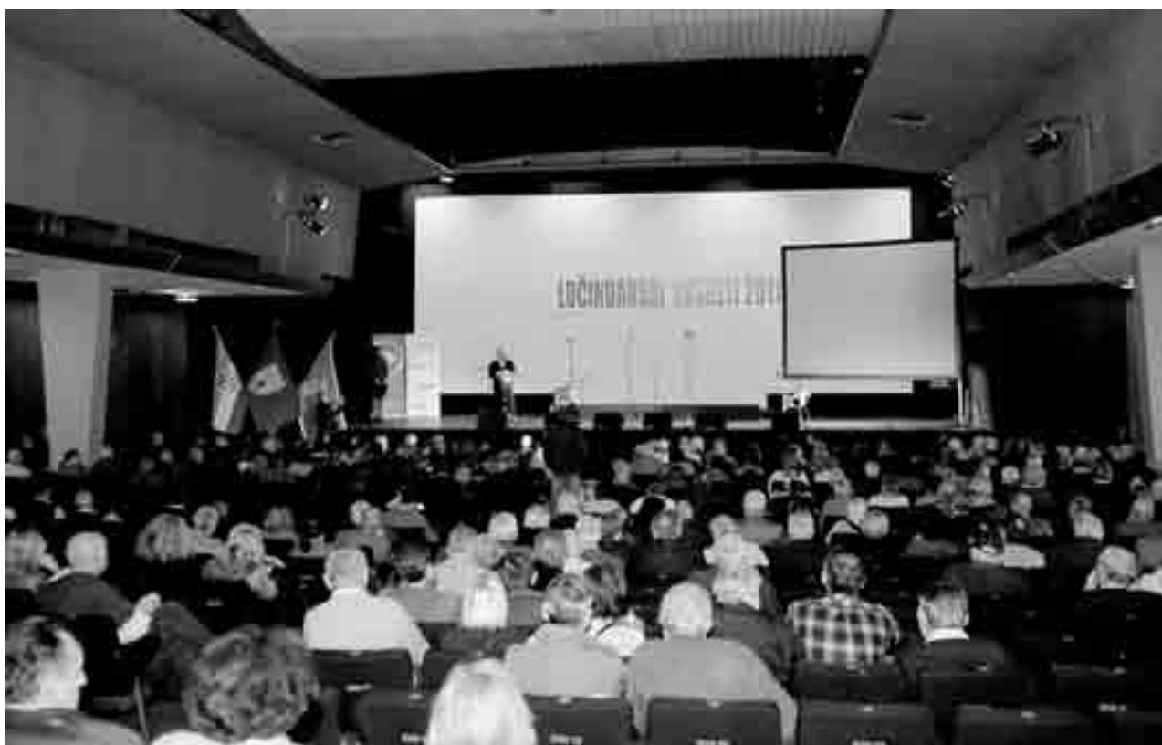
Pogled na Kino dvoranu Studentskog centra u Zagrebu

„Crnogorski glasnik“ izlazi uz potporu Savjeta za nacionalne manjine Republike Hrvatske. Pozivamo Crnogorke, Crnogorce i sve prijatelje da svojim sugestijama, prijedlozima i priložima pomognu redakciji „Glasnika“ na poboljšanju i daljnjem izlaženju lista. Tekstovi nijesu lektorisani te se izvinjavamo autorima i čitaocima.