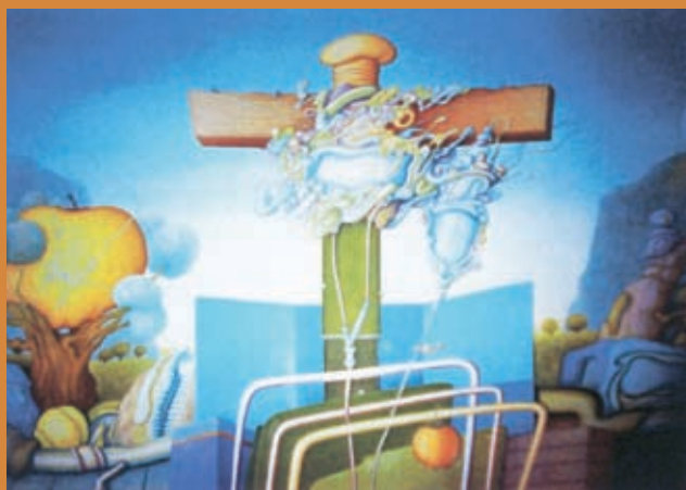
Zaboravljena dolina (ulje na platnu, 1994.)