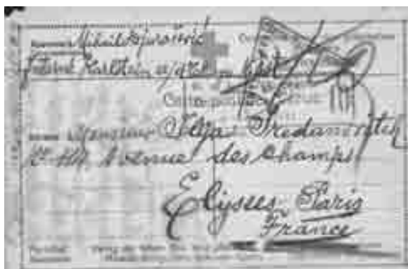
Dopisnica iz internacijskog logora Karlstein za crnogorske ratne zarobljenike

na austro-ugarskog prijestolonasljednika Franju Ferdinanda i austro-ugarskog ultimatumu Srbiji tražio da se Crna Gora odmah pridruži Srbiji u njenoj svetoj borbi «žrtvujući sve za otadžbinu, za spas i ujedinjenje srpstva.» Ulazak Crne Gore na strani Srbije i Antante u Prvi svjetski rat nije donio ništa dobro. Crna Gora je nakon dvogodišnje borbe kapitulirala pred austro-ugarskim trupama 1916. godine, dok je većina viđenijih crnogorskih političara i generala skupa s Drljevićem internirana u austrijskim logorima u unutrašnjosti. Drljević je u logoru Karlstein u Donjoj Austriji ostao do kraja rata. I u zarobljeničkom logoru je ostao pobornik ideja za koje se zalagao u svom prethodnom političkom radu.