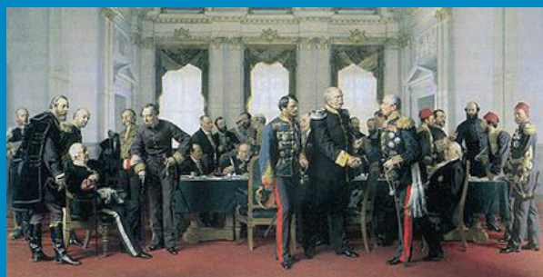
Berlinski kongres 1878.