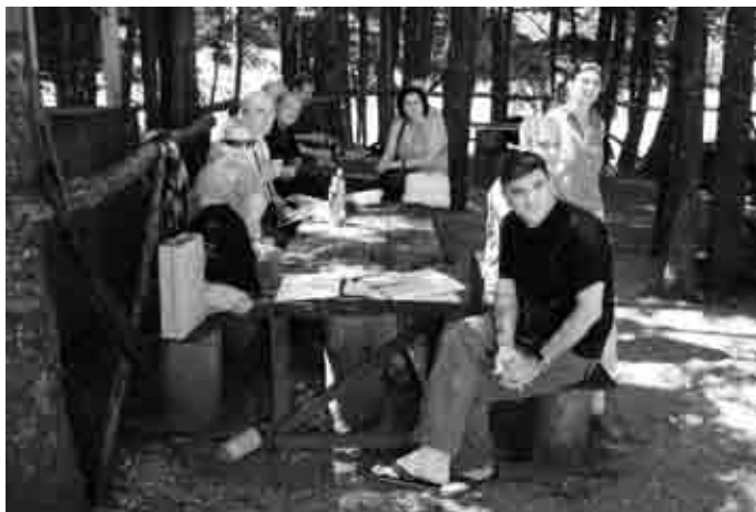
Uživalo se i u ovogodišnjem programu,