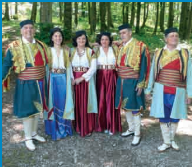
... i gizdavih nošnji ...