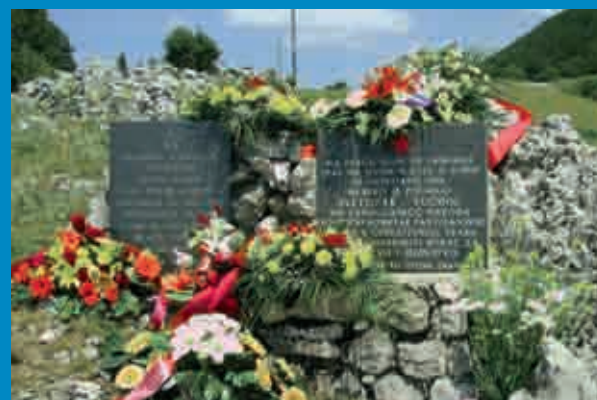
Mala Učka 2011.