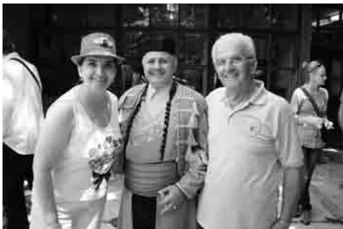
... fotografirali smo se za uspomenu ...