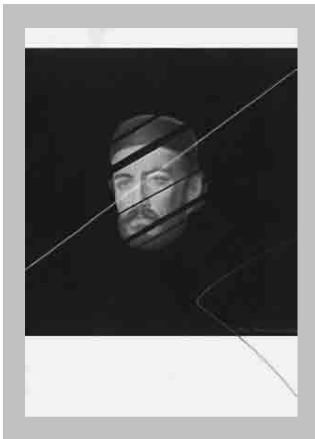
NJEGOŠ ( olovka u boji, tempera, akvarel / papir, 49,5 x 35 cm, 2011. )

Smatrao sam da u ovaj ciklus radova koji je puno rječitiji od ovih par sažetih eksplikacija, moram unijeti pjesnikov lik. U tu sam svrhu kao model koristio nekoliko Njegoševih općepoznatih portreta. Svu sam pažnju usmjerio na pjesnikovo lice, na njegovu glavu, na taj, u duhu Luče kazano sferni oblik mikrokozma.