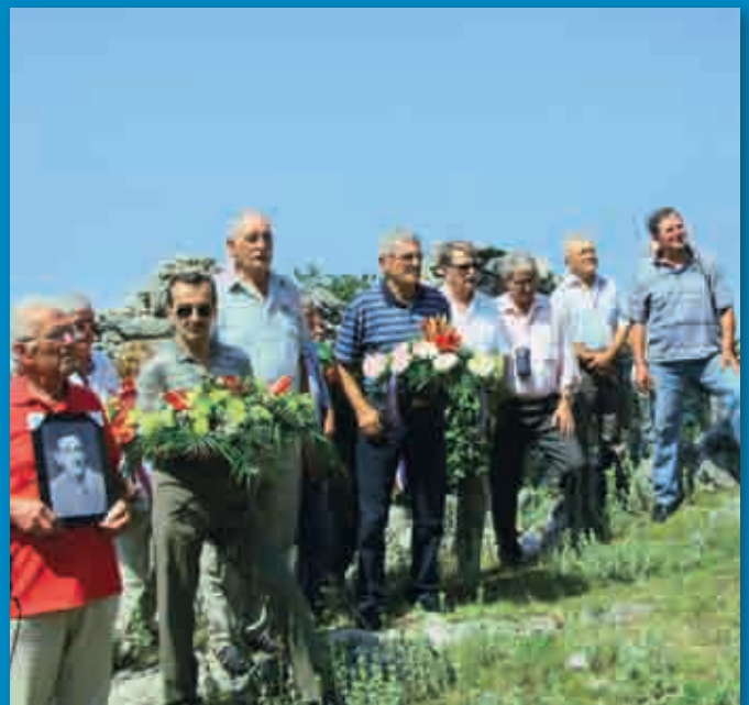
SJEĆANJE NA ANTIFAŠISTE