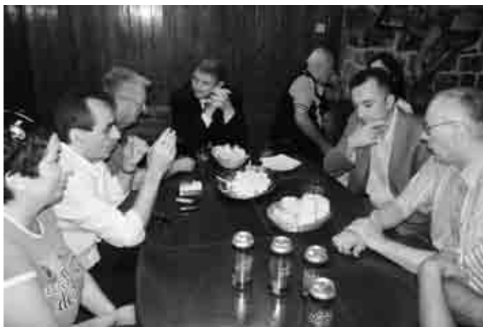
... ali bogami i na „Odlikovano“,