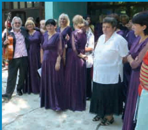
... i prelijepih oprava,