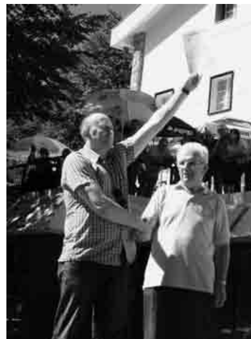
... i ponijeli brojne diplome!