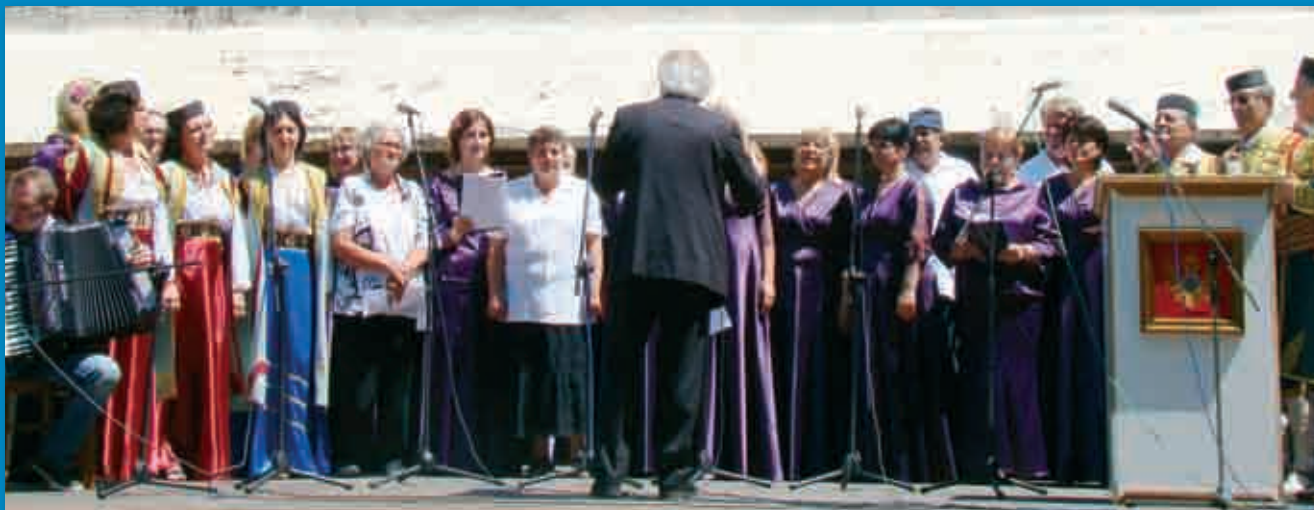
Zborovi „Bulbuli“ i „Montenegro“ (Zagreb)