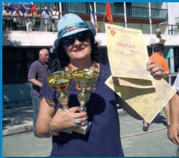
... a bješe i slavodobitnika!