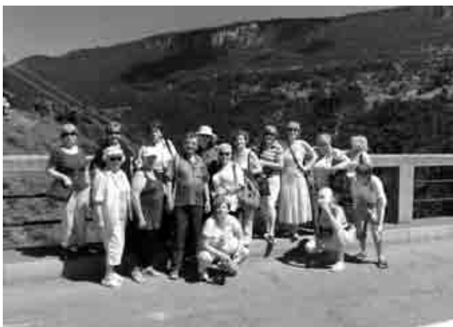
Eto nas na Đurđevića Tari! (veći dio naše male splitske ekipe)

Budi nas oštri planinski zrak, neki se teško aklimatiziraju na ovu nadmorsku visinu a ipak rado, nakon obilnog doručka, krećemo na Đurđevića Taru diviti se veličanstvenom mostu. Zaboravih reći da je četvrtak u Žabljaku pazarni dan i mi pođemo do Tržnog centra, nakupujemo domaće kajmaka, sira, meda i rakije pa tek onda u autobus. Svega smo toga u Splitu željni pa ćemo guštati po povratku, i mi i ukućani.