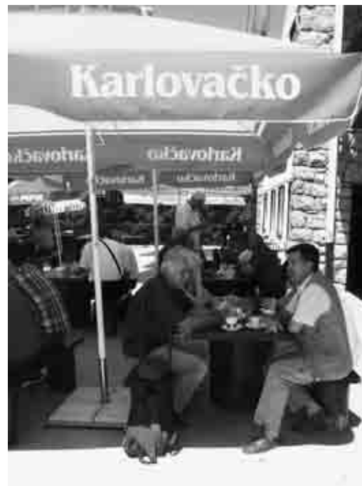
... išlo se na „Karlovačko“,