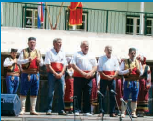
KUD „Peroj - 1657“ (Peroj)