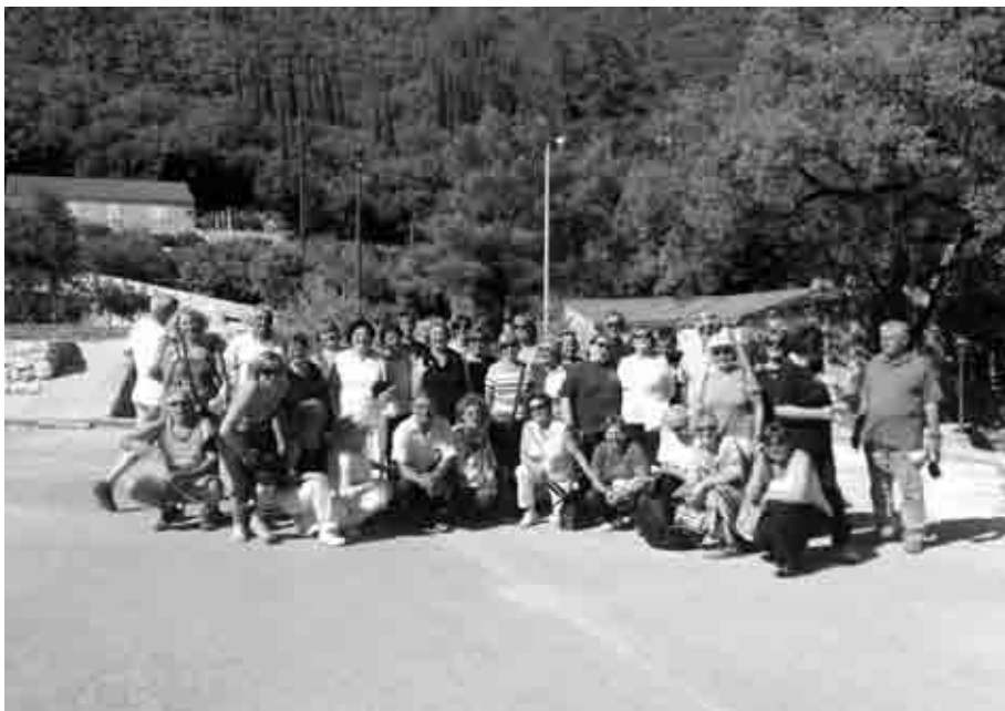
Za kraj grupno slikanje i put prema Splitu!

glavnome trgu. Ali kako natrag? Srećom, spas (neki od nas) nalazimo u taksiju. Za pet minuta i dva eura taksist nas doveze uzbrdo do autobusa i mi se uputimo prema granici i dalje prema Konavlima. A tamo, u hladu „Konavoskih dvora“ tik uz rječicu i uz škripu vodeničnog kola ručamo, onako kraljevski, polako i sve po redu.