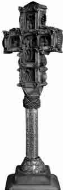
Križ - poklon Petra II Petrovića Njegoša popu Lazaru Popoviću- Jabučaninu, 1834. g. (Njegošev muzej, Cetinje)

Njegoš se zavladičio u Petrogradu 18.VIII.1833. godine. Kada se vratio na Cetinje mom je pretku kao odanom Crnogorcu kojeg je primio u svoju službu u Cetinjski manastir 1831. godine, poklonio križ na kojem je ugravirano: "Vladika Crnogorski Petar II Jereju Lazaru Popoviću, 1834. godine, prvog januara". Ovaj vrijedni predmet koji je pripadao mojoj obitelji danas je izložen u Njegoševom muzeju u Biljardi na Cetinju. Koristio sam ga kao element u kompozicijama ciklusa Corpus Mysticum i u recentnim radovima inspiriranim Lučom mikrokozma . Časni simbol kršćanske vjere i nijemi svjedok događanja jednog burnog razdoblja simbolički ukružuje Njegoševo i naše vrijeme.