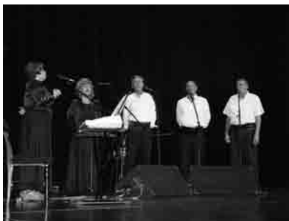
Sa svečane akademije u Rijeci