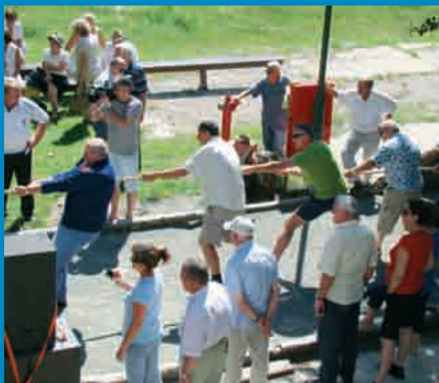
... bješe i „povuci, potegni“,