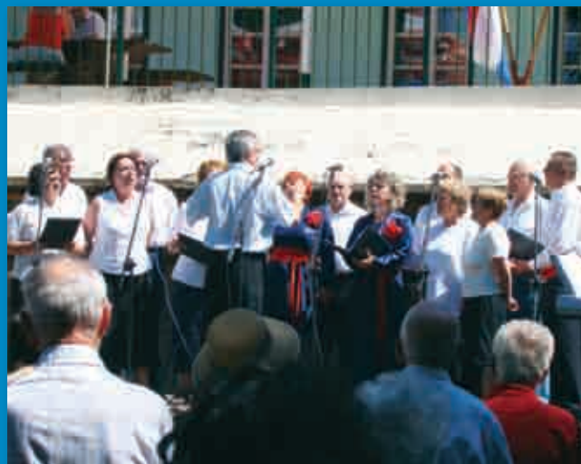
Klapa „Drenova“ i „Montenegrine“ (Rijeka)