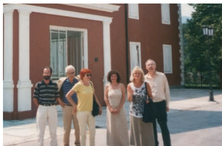
... bili smo i „kongresmeni“ (Cetinje, 2000.)