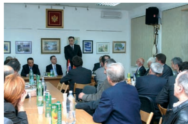
... dočekivali smo mnoge uglednike (2007.),