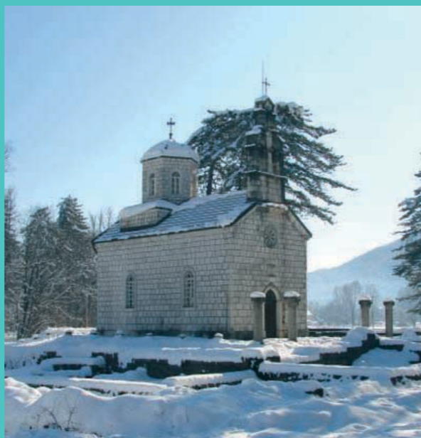
Dvorska crkva na Čipuru (Cetinje)