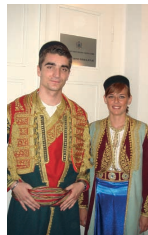
... vazda se radujući i mladima i boljima!