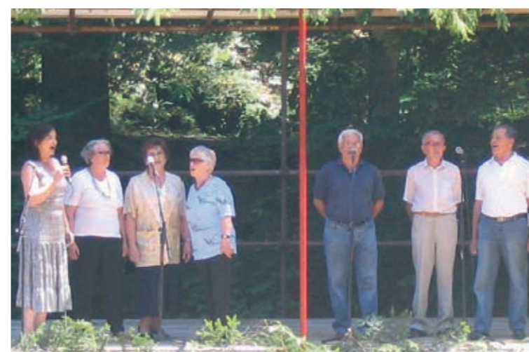
... učestvovali na Petrovdanima (Golubinjak, 2007.)