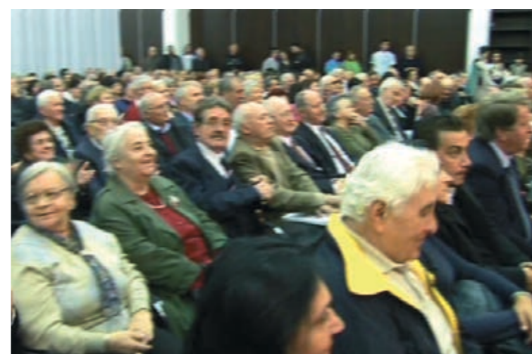
... susreli se i 11. put o Lučindanu (2010.),