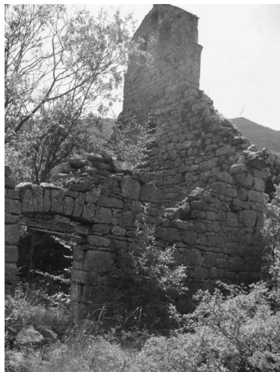
Ostaci crkve sv. Luke u Dabašnici

Crnogorci u Hrvatskoj, kao tradicionalna manjinska zajednica, baštine i jedan broj značajnih spomenika materijalne kulture. Nauka, ukoliko izuzmemo Peroj, na žalost, nije značajnije tretirala povijest crnogorske zajednice u Hrvatskoj, a ono što je naučno valorizovano je samo segmentarni prikaz jedne, vjerujemo mnogo opširnije i bogatije povjesne priče o Crnogorcima u Hrvatskoj i suživotu Crnogoraca i Hrvata u Hrvatskoj. Polazeći od ove činjenice, krenulo se u jedno ozbiljnije istraživanje tragova crnogorske povijesti u Hrvatskoj.