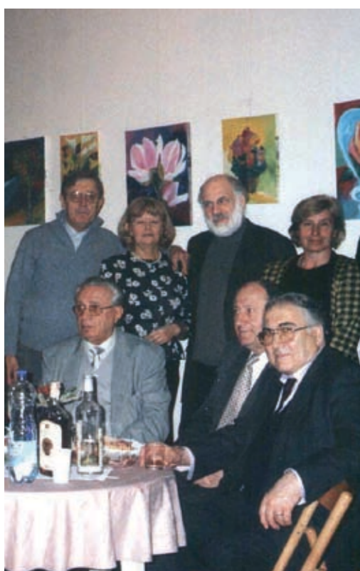
... slavili i Božiće i Uskrse,