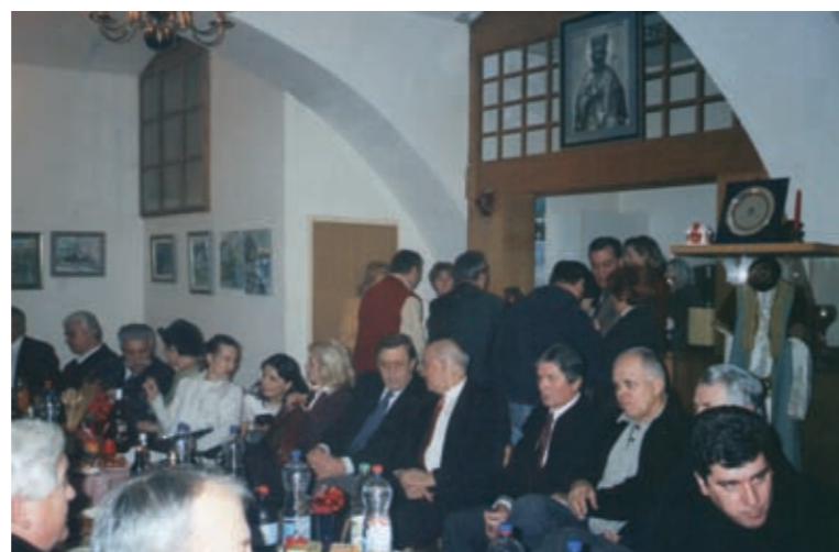
Počinjalo se 90-tih u Vinogradskoj,