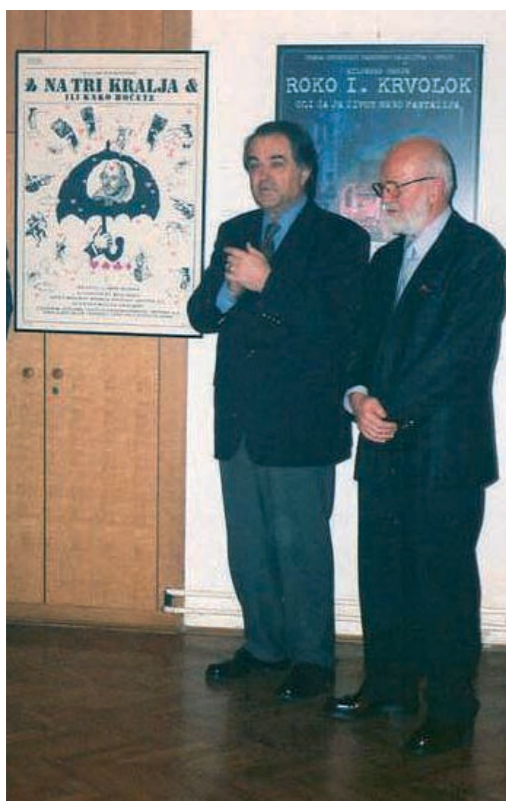
... i već tada smo imali brojne izložbe,