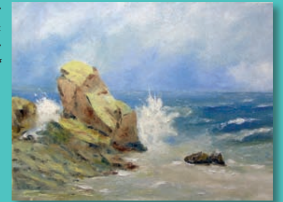
Sa izložbe slika udruga „Veli pinel“