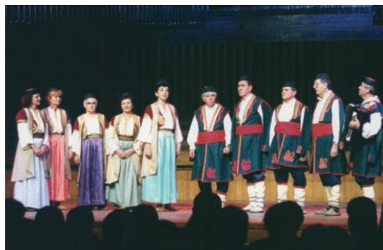
... pjevali smo i u „Lisinskom“ (2001.),