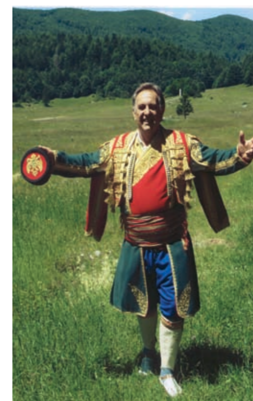
... bogami smo se i zorili (Platak, 2010.),