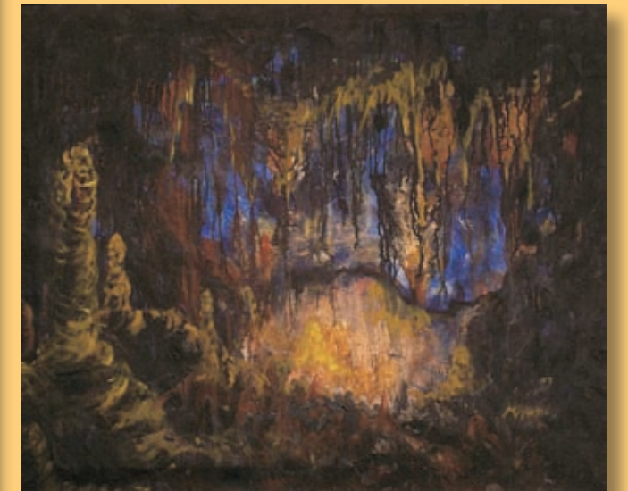
Nivess Missoni: „Baračeva špilja“ (ALTI art speleo galerija)