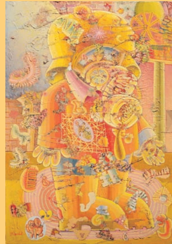
“Čistunac” (slika sa izložbe Ratka Odalovića)

Korača, korača svezana Crna Gora preko Crne Gore. Žandari viču. Žandare ostrvljuje miris strvi. Bije kundak. Bodež bode ... Kolona korača preko prosute vode – žedna vode. Kolona korača preko prosute krvi – žedna krvi. Žedna krvi!