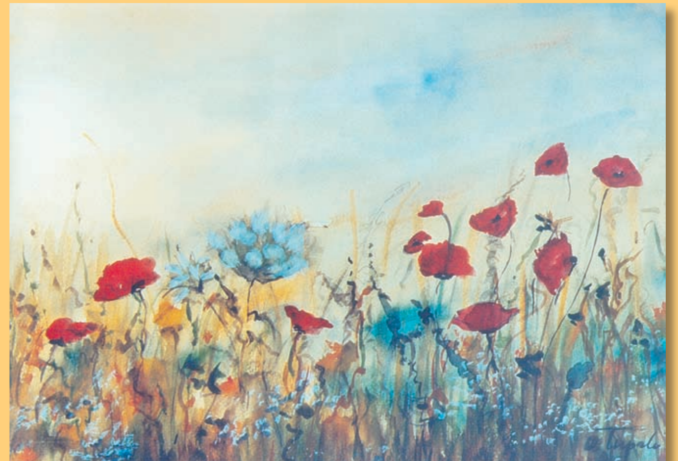
„Makovi u polju“ (slika sa izložbe Olge Tripalo)