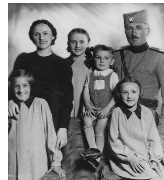
Sa roditeljima i „onim malenima“

A dokaz nad dokazima da sam „velika i pametna djevojka“ bila je odluka mojih roditelja da me preko ljeta pošalju u Crnu Goru, u očevu rodno selo. Brat je bio sasvim mali i majka je morala ostati u Sarajevu. Otac je, čini mi se, morao na neke manevre. Budući pak da je bilo krajnje vrijeme da upoznam očevu postojbinu