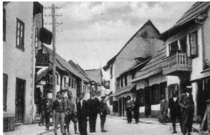
Glavna ulica u Andrijevi (tridesetih godina prošloga stoljeća)