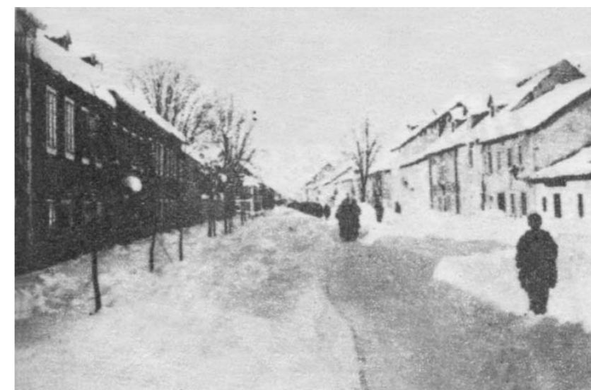
Cetinje pod snijegom (kraj 19. vijeka)

Pozivamo Crnogorke, Crnogorce i sve prijatelje da svojim sugestijama, prijedlozima i priložima pomognu redakciji Crnogorskog glasnika na poboljšanju i daljnjem izlaženju lista. Tekstovi nijesu lektorirani te se ispričavamo autorima i čitateljima.