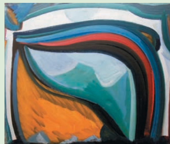
Slika akademskog slikara Slobodana Vuličevića iz kolekcije Zavičajnog muzeja Grada Rovinja