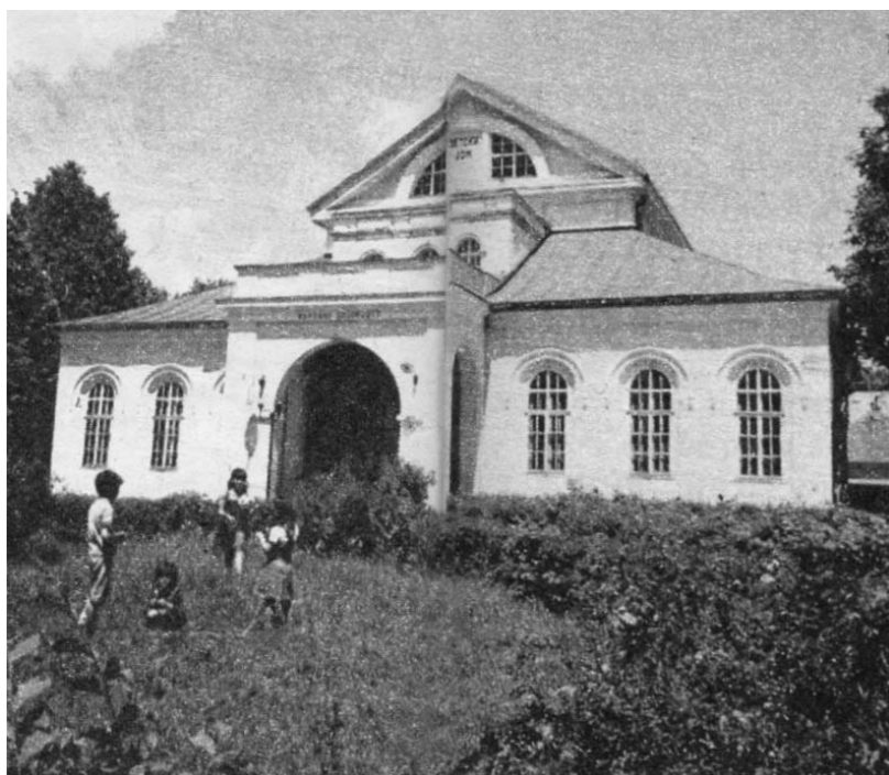
"Zetski dom" na Cetinju