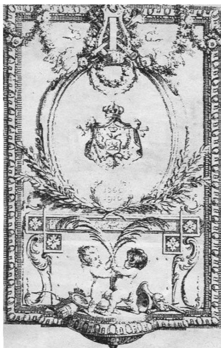
Pozivnica za "Zetski dom"

da nam izvoli dati u zajam rukopis „Balkanske carice“, da je dobrovoljno društvo čitaoničko bude moglo prikazati!