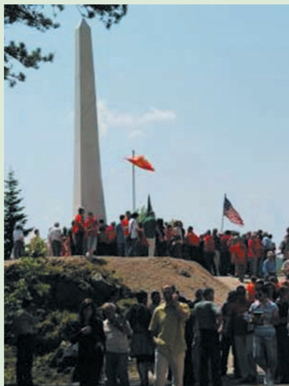
Obelisk borcima za nezavisnu Crnu Goru u Bajicama kod Cetinja

Dan Vijeća crnogorske nacionalne manjine Grada Zagreba