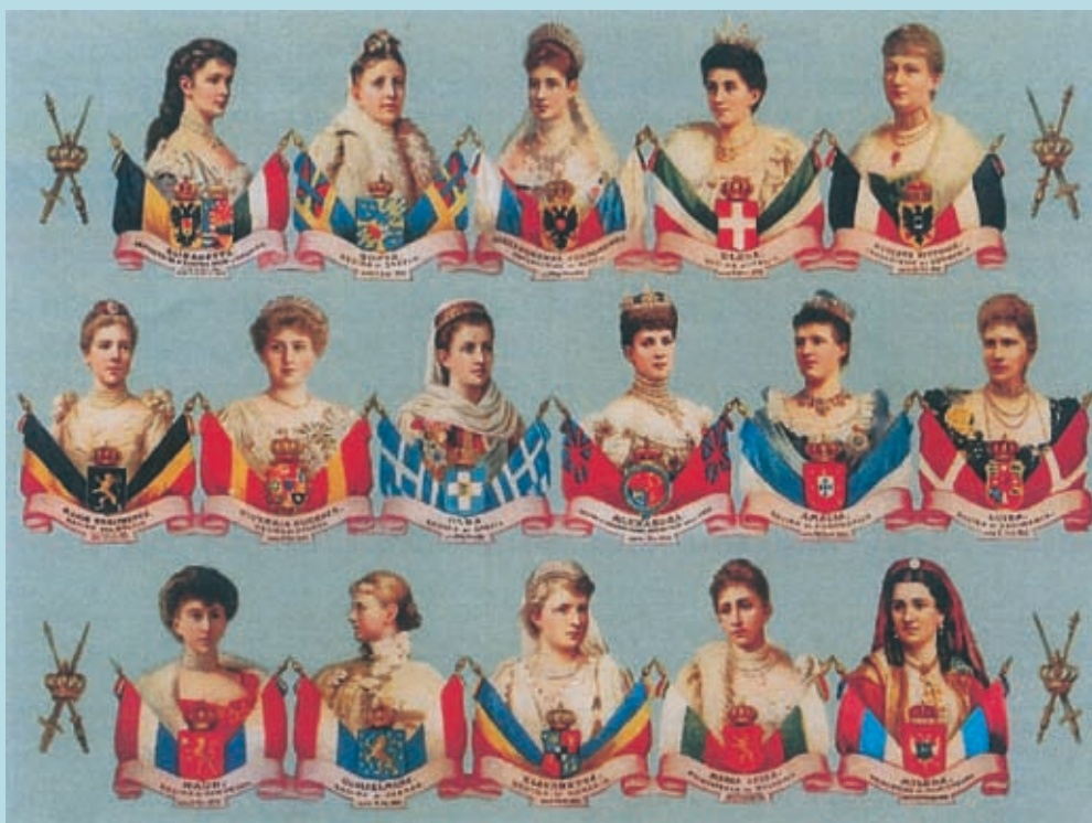
16 EVROPSKIH NAJVEĆIH DRŽAVNICA MEĐU KOJIMA I MILENA PETROVIĆ