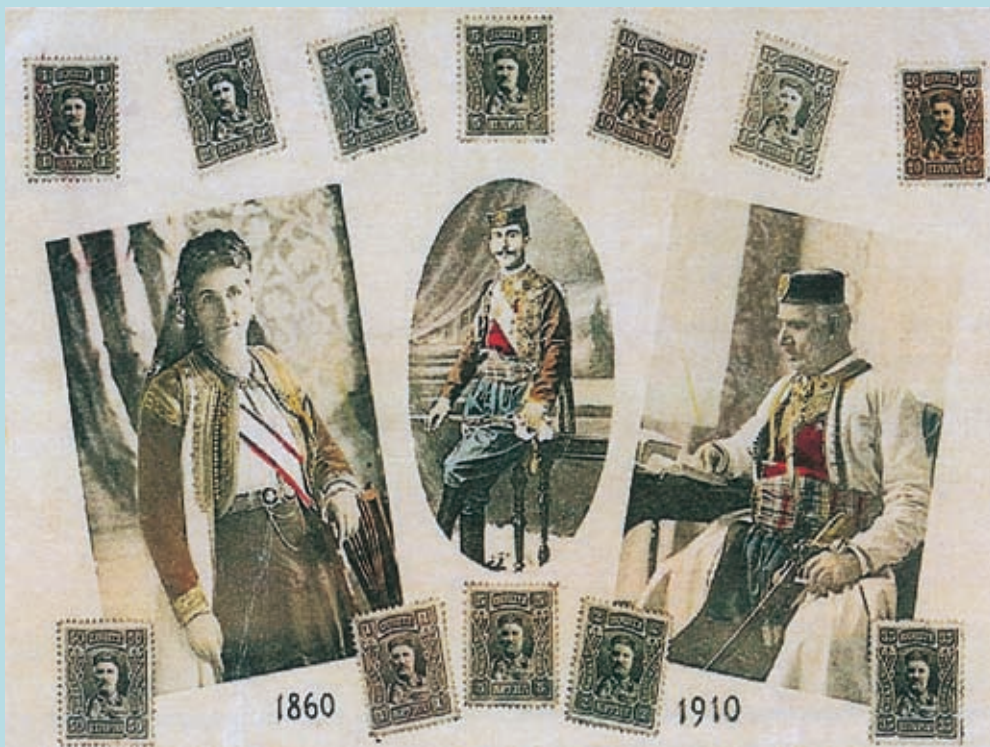
KRALJI I KRALJICA SA PRESTOLONASLJEDNIKOM I FILATELISTIČKIM MARKAMA